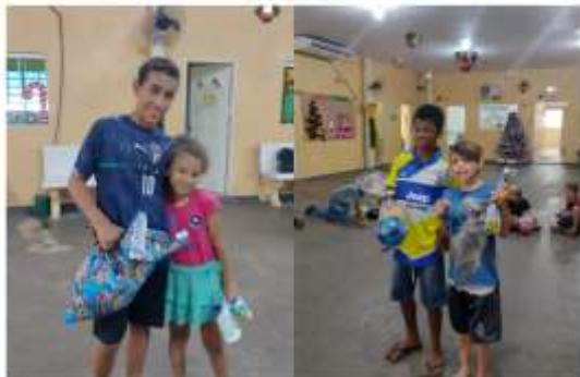
AMIGO SECRETO CAMENOR